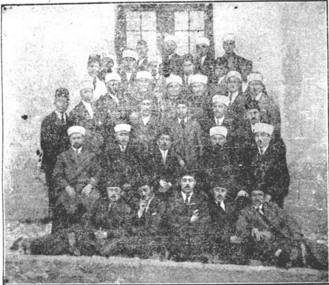
Un grup de absolvenți ai Seminarului