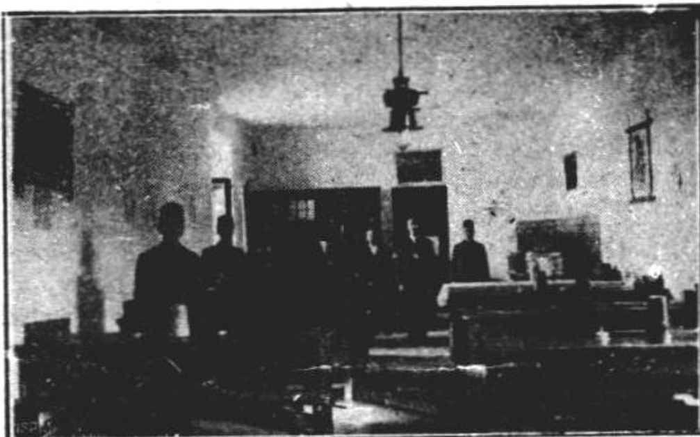
Sala de mese a Seminarului

ordinul No. 106405 11099 1932, s'a ținut în ziua de 30 Sept. 1932, când au fost primiți 12 elevi bursieri.